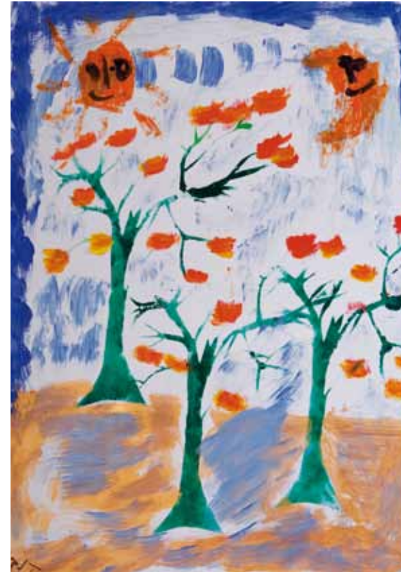
Charakteristisch für seine Arbeiten ist ein Minimum an Objekten und Details. Er betrachtet die Bildfläche als weiten Raum, in den er wenige Dinge mit großer Ausdrucksstärke hineinstellt.