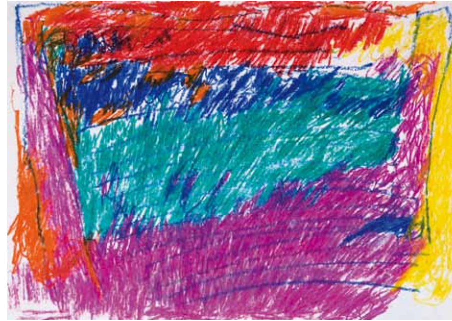
Er arbeitet in einer betreuten Werkstatt. Seine Kunstwerke sind von abstrakter Art, charakterisiert durch feine Linien und Sensibilität für Farben.