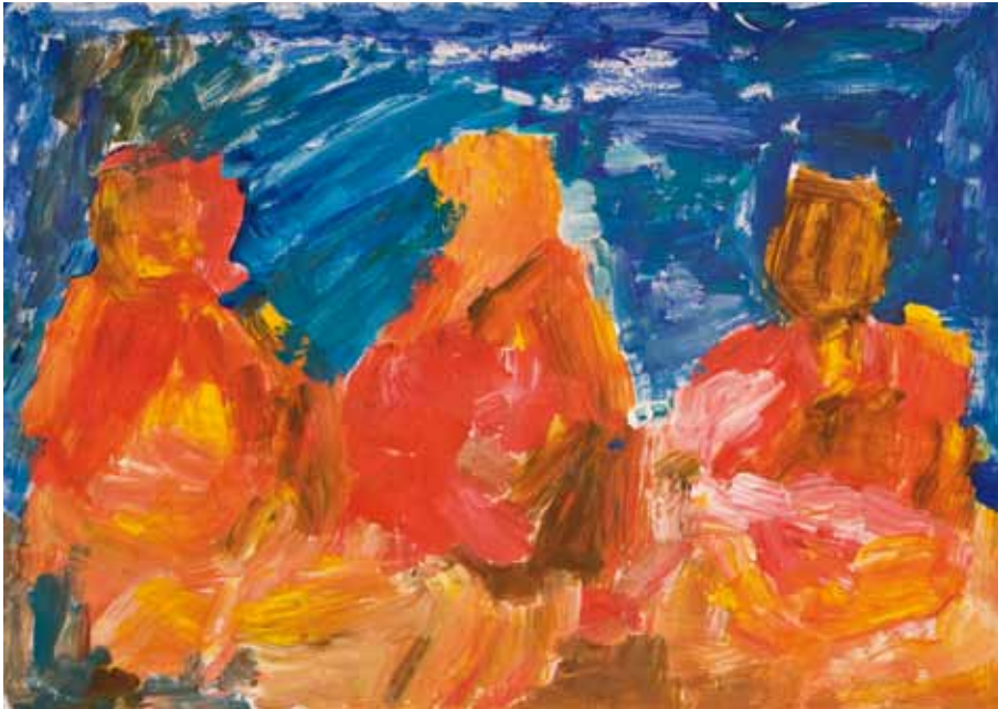
Schmuel Nahon ist 66 Jahre. Er lebt in einem Wohnheim und arbeitet in einer betreuten Werkstatt. Gerne in Gesellschaft geht er täglich zur Synagoge. Aktiv in Töpfer-, Gymnastik- und Tanzgruppe; er besucht auch den Fitnessraum.