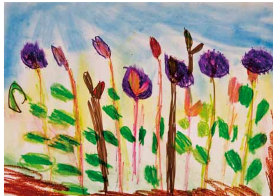
Dabei wiederholt sie das Ziehen des Pinsels oder Stiftes auf dynamische Weise. Eine vielfache Wiederholung einfacher Naturgegenstände bestimmt ihre Bilder, die wie ein Seismograph ihre Stimmungslage und Gefühle zeigen.

›Blumen im Frühling [1]‹ | Wachsmalstift auf Papier