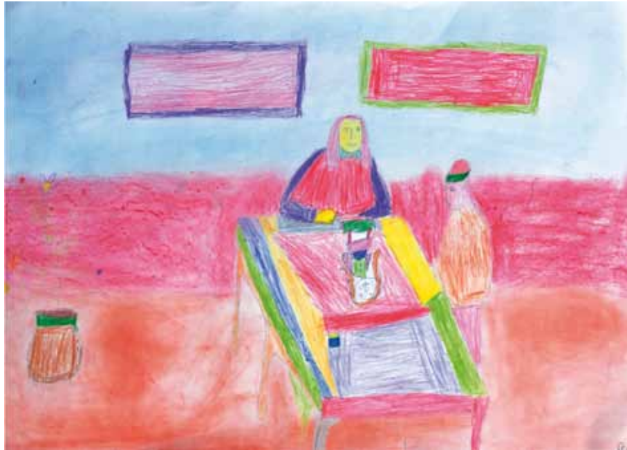
Avital Misrachi ist 40 Jahre alt. Sie liebt Musik, singt und schwimmt gerne. Sie lebt mit zwei weiteren Frauen in einer betreuten Wohnung. Avital arbeitete viele Jahre in einem Kindergarten.