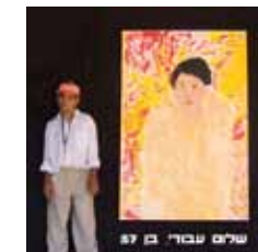
ohne Titel [2] Acryl auf Papier

Trotz dieser physischen Einschränkungen ist sein Arbeitsprozess von großer Selbständigkeit gekennzeichnet. Meist zeichnet er sitzend, wobei das Blatt auf der Erde liegt. Seine Bilder sind abstrakt und zeigen eine starke physische Präsenz.