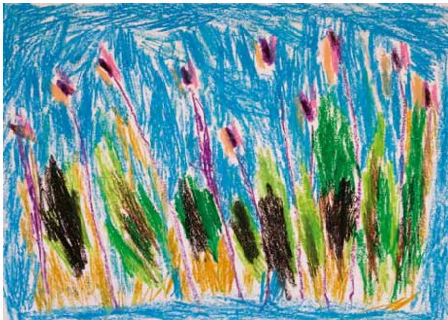
Pirchia Nissim ist 50 Jahre alt. Sie macht gerne Ausflüge und besucht auch gerne ihre Familie. Sie wohnt in einem betreuten Wohnheim und arbeitet in einer betreuten Werkstatt. Ihr künstlerischer Arbeitsablauf zeigt Schnelligkeit, Eile.