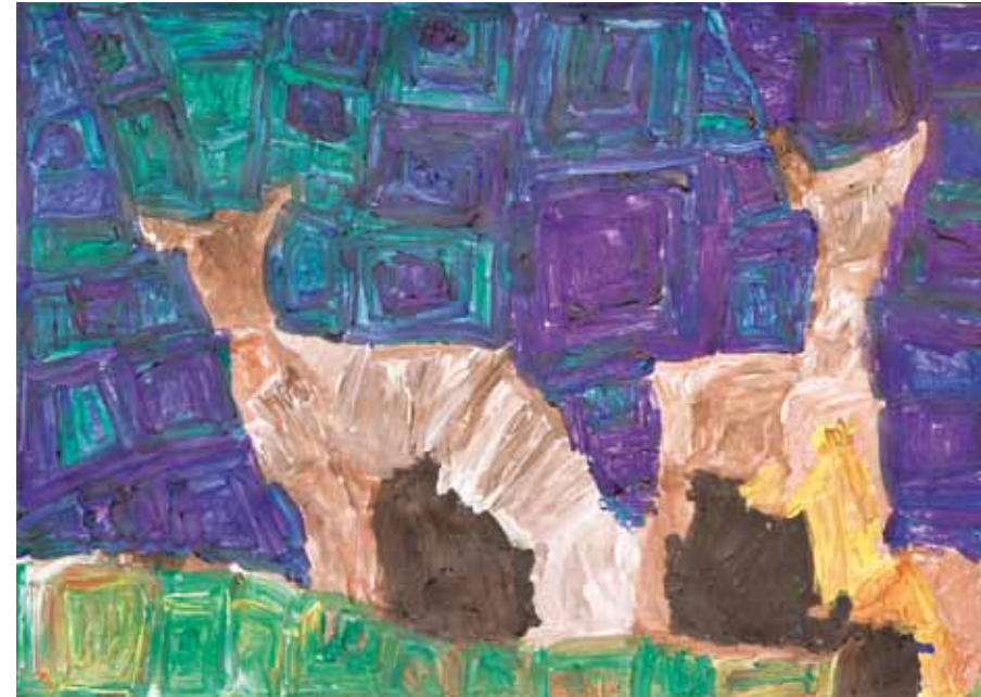
Schmuel arbeitet mit fotografischen Vorlagen. Er teilt – dies ist seine besondere Technik – die Bildfläche in kleine Farbflächen auf. So interpretiert er Fotografie neu in Farben, Flächen, Formen.