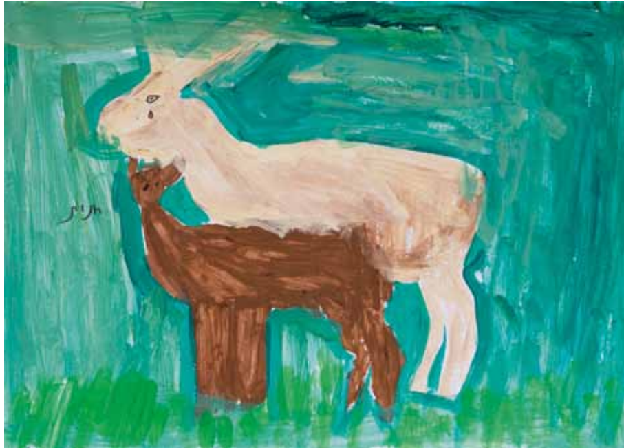
Ronit Mischli ist 43 Jahre alt. Sie lebt in einem Wohnheim und arbeitet in einer betreuten Werkstatt. Bei gesellschaftlichen Aktivitäten freut sie sich mit Singen und Tanzen. Ronit ist in ihren physischen Fähigkeiten stark eingeschränkt.