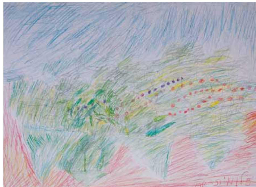
Sensibilität, Farbenreichtum und Liebe zum Detail zeichnen ihre filigranen Werke aus. Die Themen entstammen vor allem der Natur.

›Ausflug in die Natur‹ i Pigment, Buntstift auf Papier