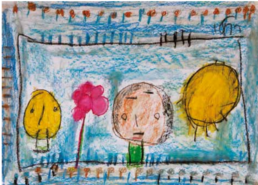
Rachel Cohen ist 39 Jahre alt. Sie lebt in einem betreuten Wohnheim und arbeitet in einer Kindertagesstätte. Sie spielt in der Akim-Jerusalem-Theatergruppe, töpft und singt und tanzt gerne.