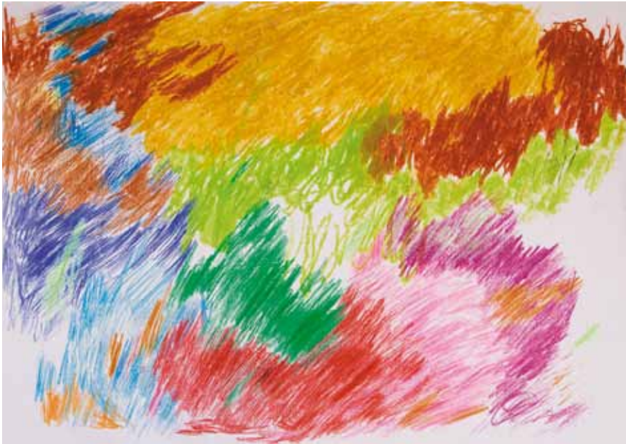
Ivgeni Scheinen ist 52 Jahre alt und 1985 aus der UdSSR eingewandert. Er spricht Russisch, doch er versteht ohne Schwierigkeiten Hebräisch. Ivgeni singt gerne, mag Gymnastik und nimmt an Parties und Ausflügen teil.