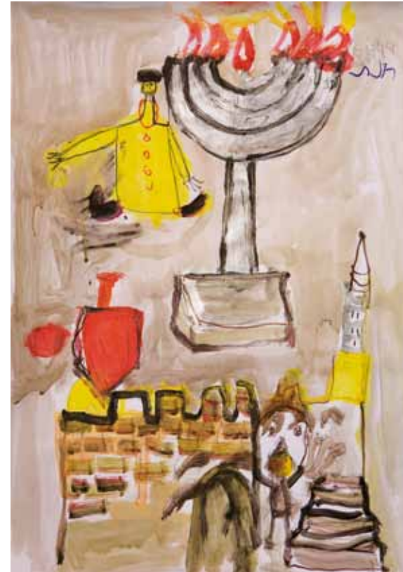
Ihre Bilder sind durch intensive Farbgebung, starken Ausdruck und expressive Pinselstriche gekennzeichnet, die ihnen eine besondere Atmosphäre geben und eine starke emotionale Kraft widerspiegeln.

›Große Freude‹ i Wasserfarben auf Papier