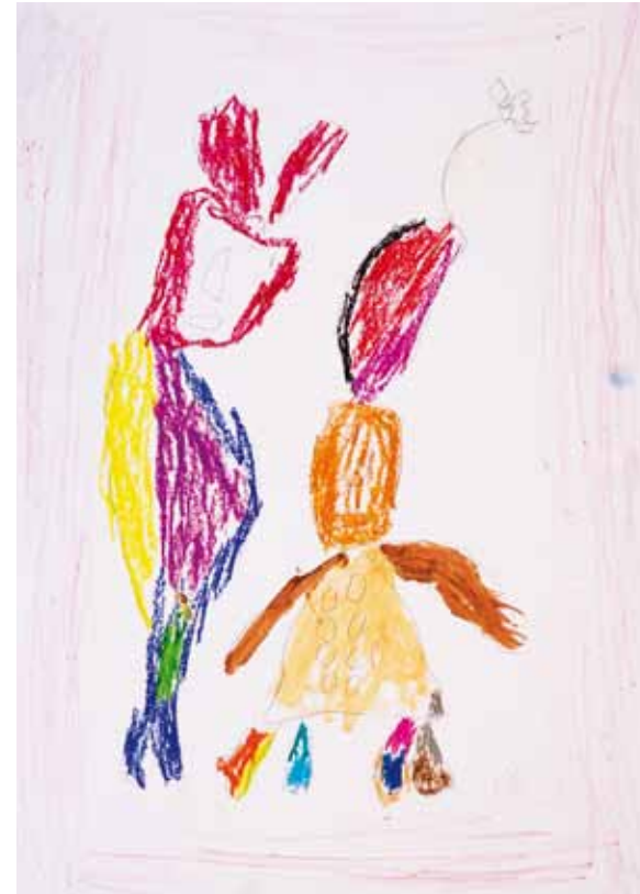
Seine Werke zeigen ausdrucksstark seine Erfahrungen. Er beginnt immer mit einer genau fixierten Idee, entwickelt seine Vorstellungen dann im malerisch Konkreten, wobei er sehr frei vorgeht.

›Tiere im Wasser‹ | Bleistift und Buntstift auf Papier