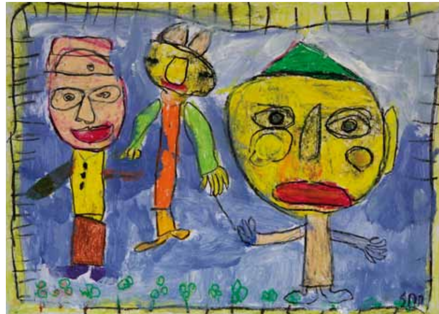
Als Mitglied einer Gymnastikgruppe trainiert sie auch im Fitnessraum. In ihren Bildern zeigt sich ihr Sinn für Farbe und Komposition. Sie entfaltet gut erkennbar in ihrer Eigenheit eine ganz eigentümliche Vorstellungswelt.

›Ich und meine Freunde‹ | Acryl und Wachsmalstift auf Papier