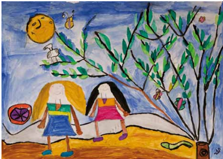
Tamar Asraf, 38 Jahre alt, lebt in einer betreuten Wohnung und arbeitet in einer Konditorei. Sie ist Mitglied einer Theatergruppe, geht gerne in die Disko und besucht auch den Fitnessraum.