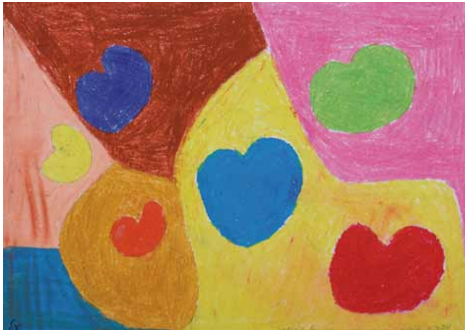
Yael Ben-Chaim ist 26 Jahre alt. Sie liebt Aerobic-Tanz und Theater. Sie wohnt in einer betreuten Wohnung für junge Frauen. Yael nimmt an einem speziellen Programm der Hadassah-Universitätsklinik teil.