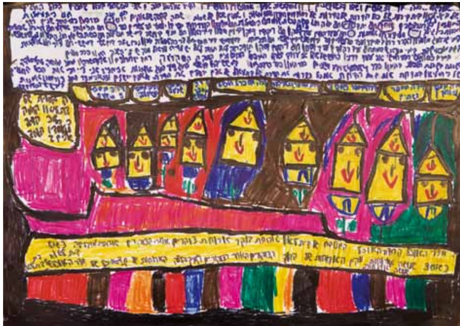
Uriel Sneh ist 36 Jahre alt. Uriel wurde mit Down-Syndrom geboren. Er schreibt Tagebuch, fotografiert, singt und spielt Theater, und er schwimmt wie ein Fisch. Er lebt in einer betreuten Wohnung im ›Beth-Leo-Wohnheim‹ und arbeitet in einer betreuten Werkstatt.