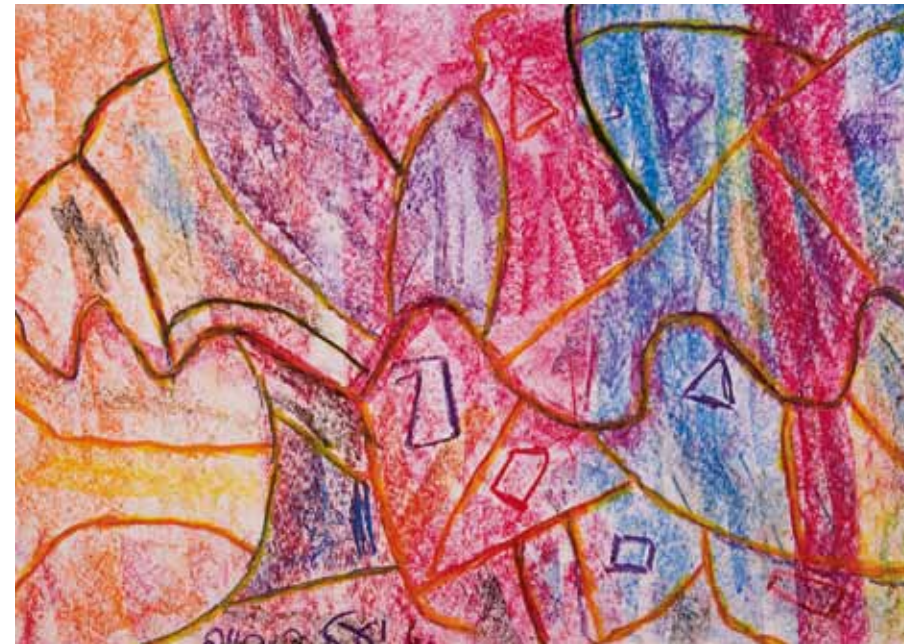
Der ihren Bildern eigene Stil zeigt sich in der Wahl ausdrucksstarker Techniken.

›Herztreffen‹ i Wachsmalstift auf Papier