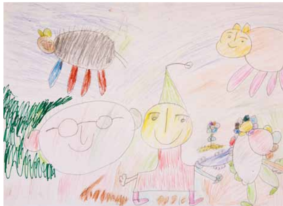
Avner hat eine ihm eigene und sehr entwickelte Vorstellungswelt. Er beherrscht ein weites Spektrum von Techniken. Gerne möchte er eine eigene Ausstellung seiner Werke durchführen.

›Ausflug von Freunden in die Natur‹ | Filzstift auf Papier